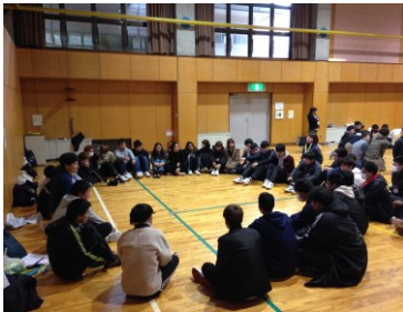
自己発見とキャリア開発Aの様子

そこでK05クラスでは、前期で学んだコミュニケーション力等を実習し、さらには、よりリアルに「夢の種」を思い描くべく、I-Iグランプリへの出場を決めた。つまり、本企画の目的は、チーム・ビルディングが試され、なおかつ、企業人と直接、対峙するI-Iグランプリを通じて、初年次教育の教育成果を確かなものとするのであった。