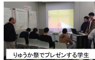
りゅうか祭でプレゼンする学生