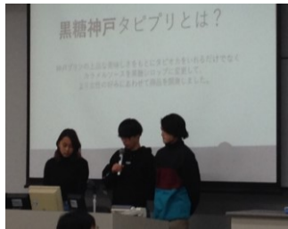
中間プレゼンテーション大会