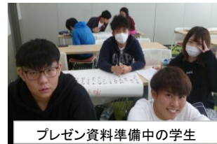
プレゼン資料準備中の学生

社会人を説得するために求められる能力ープレゼンテーション能力、論理的思考力等の必要性を痛感し、そのワンステップとなるような能力は身につけたように思う。