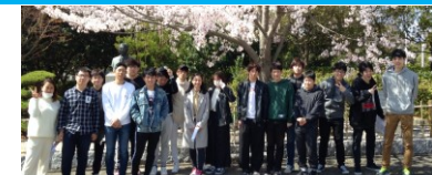
「自己発見とキャリア開発」K05クラス