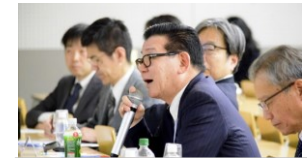
学生に鋭い質問を浴びせる審査員

I-Iグランプリにおける学生の役割は、グランプリに出場し、企業から出された課題に対する答えをプレゼンすることにある。したがって、大会運営そのものは本学事務局を中心に進められるため、比較的、学生が参加しやすい形態の社会共創活動であると言えるだろう。とはいえ、大会テーマは、参加企業にとっては死活的な課題であるため、プレゼンに対する審査員の視線は厳しい。学生・生徒は、これに応え得る水準のプレゼンが求められる。なお、K05クラスは他の「自己キャリアB」クラスと足並みを揃える必要があるため、授業時間外の作業は、担当教員による指導は控えられ、各チームの自主性に任せられた。